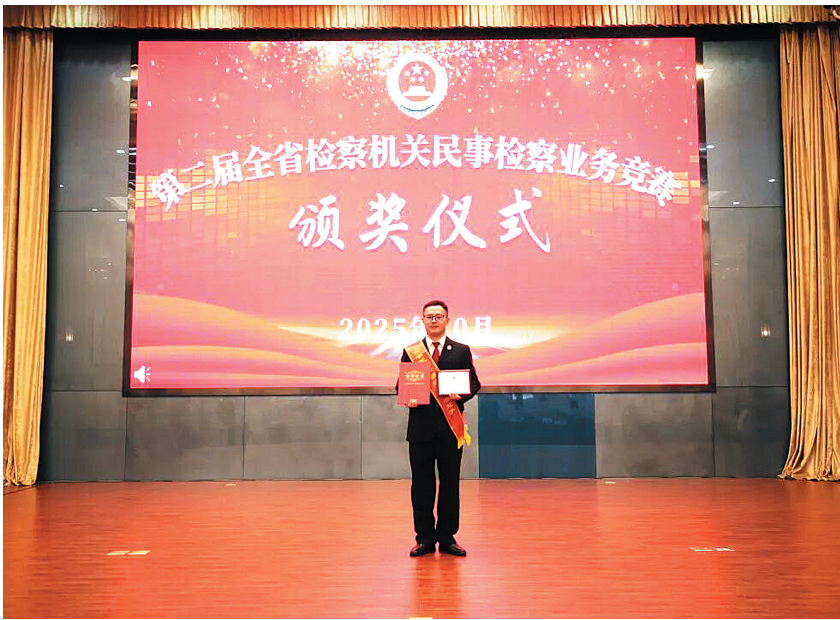
本报记者 谢勇 本报通讯员 丹检

从检 11 年多来，他办理的 7 起案件获评省级以上典型案例，先后荣获个人三等功 2 次，被确定为全省检察人才，入选全省民事检察人才库，荣获全省民事检察业务能手、镇江市检察机关青年业务拔尖人才、镇江市检察机关案例撰写标兵等称号。